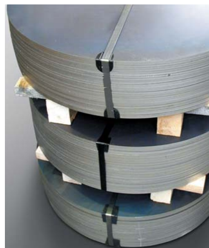
Ronden für die Papierkreismesserindustrie und die Herstellung von Metallkreissägen