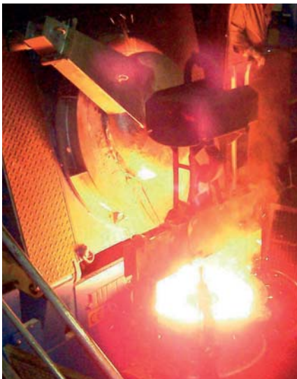
Abstich im Stahlwerk

UMAG ▶ Entsprechen die Ergebnisse Ihren Erkenntniszielen ? ▶ Viele Ergebnisse bzw. Verbesserungspotenziale waren uns bekannt und wurden durch das Projekt bestätigt. Jetzt aber haben wir konkrete Maßnahmenkataloge erstellt, so dass die Schwächen systematisch beseitigt werden können. Teilweise waren wir auch schon mit der Planung und Umsetzung solcher Dinge befasst.